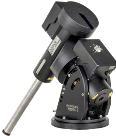
GM 3000 HPS 100 kg Tragfähigkeit