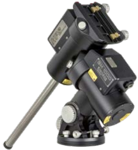
GM 1000 HPS 25 kg Tragfähigkeit