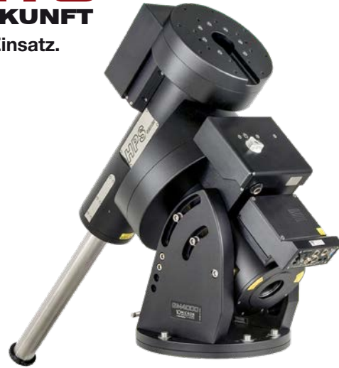
GM 4000 HPS II 150 kg Tragfähigkeit

3600 Sek. Nachführkurve 1000 HPS (R.A.-Achse) – ermittelt mit externem Absolut-Encoder