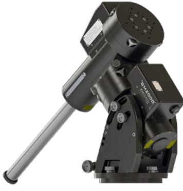
GM 2000 HPS II C 50 kg Tragfähigkeit